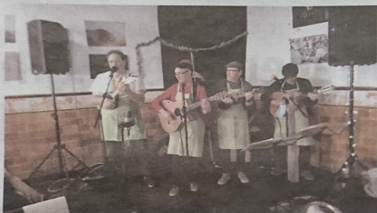
Les Grumpy's Papés ont chauffé, pendant une demi-heure, la salle du Cercle avec beaucoup de pêche et d'inspiration.

Atelier de fabrication de baumes naturels. Stand de « découverte de la permaculture » avec documentation. Un autre stand sur les abeilles. Vin chaud, assiettes des délices du potager (velouté, omelettes, tartes...) et douceurs préparées par les Graines de l'harmonie... Journée tout en harmonie au Cercle où la permaculture et ses valeurs étaient à l'honneur ce dimanche. Une