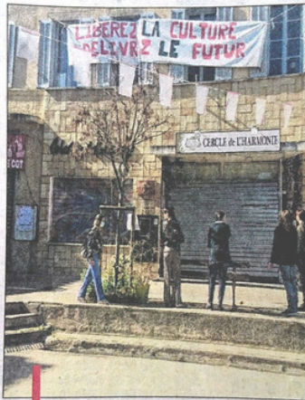
Le Cercle de l'Harmonie, la Bourse du travail, l'Union locale CGT et le bouledrome.

Mais finis aussi les jeux de boules, avec le club La Boule Harmonieuse qui est à l'arrêt,